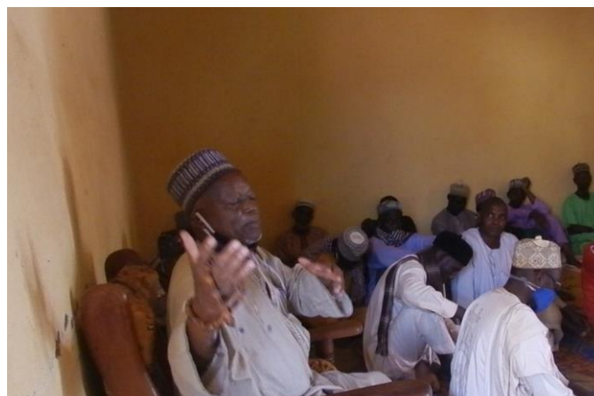
Chef de Sambo Labo, présent au cours de la réunion d'information avec les communautés