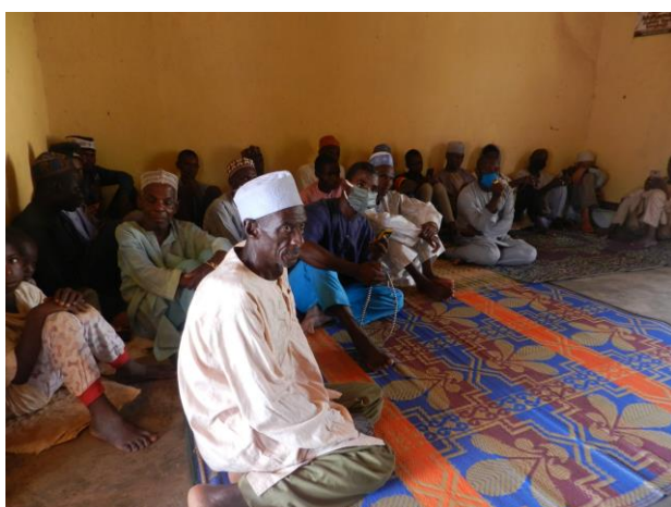
Réunion d'information avec les communautés du village Sambo Labo, riverain du massif forestier Tchabal Mbabo, ©FODER 2020