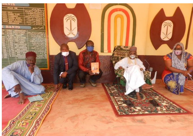
Réunion d'information sur le projet COGESPA Tchanal Mbabo au Lamidat de Banyo