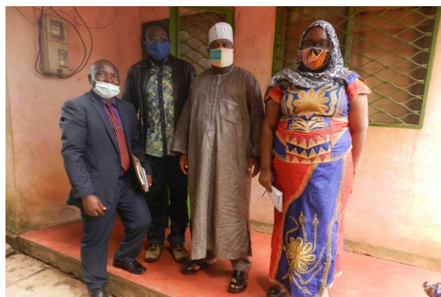
Photo de famille après échange avec l'ex adjoint au maire de Banyo, élite de Sambo Labo