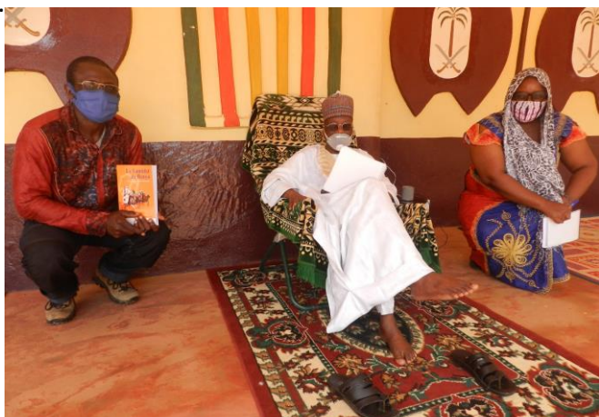
Echange avec le Lamido de Banyo.